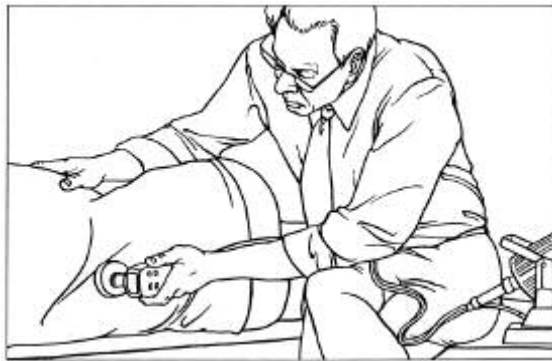
fig. 1 Percussion vibrator